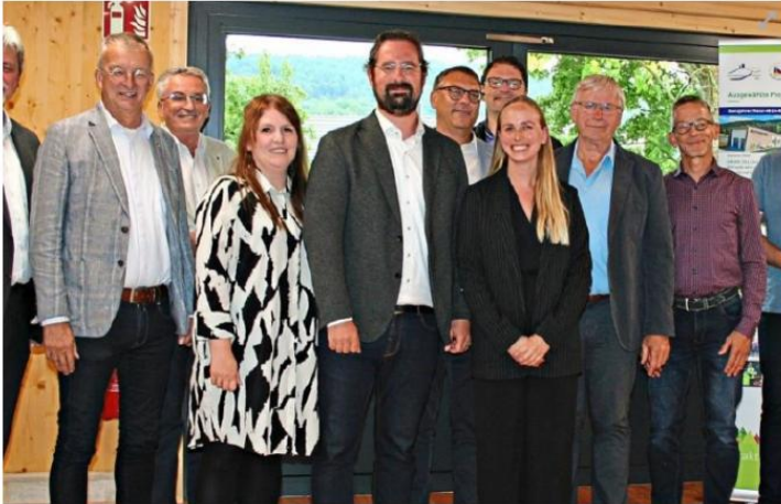
Die Verantwortlichen vom Aktionsbündnis Čerchov plus trafen sich zum Gespräch über die Zukunft.

Gleißenberg. Die Städte Furth im Wald, Rötz und Waldmünchen sowie die Gemeinden Gleißenberg, Schönthal, Tiefenbach und Treffelszein bilden zusammen das Aktionsbündnis Čerchov plus (ABC+). Es steht als Synonym für das Integriertes Ländliches Entwicklungskonzept (ILEK), bei dem Städte, Märkte und Gemeinden freiwillig interkommunal kooperieren, um die zukunftsfähige Gestaltung unserer Heimat zu ermöglichen und zu fördern, natürlich auch durch deutsch-tschechische Partnerschaften.