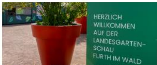
Landesgartenschau Furth im Wald 2025

Von Mai bis Oktober 2025 lockte die Bayerische Landesgartenschau in Furth im Wald unter dem Motto ‚Sagenhaft viel erleben‘ hunderttausende Besucher an und bot eine einzigartige Bühne, um die touristischen und kulturellen Stärken von Stadt und Landkreis zu präsentieren. Das Großereignis wirkte als nachhaltige Investition in die Lebensqualität und etablierte die gesamte ILE-Region als attraktive Destination. Attraktionen wie der beeindruckende Drachensteg und die neue Parkarena bleiben der Stadt und der Region dauerhaft erhalten und dienen künftig als hochwertige Veranstaltungsorte.