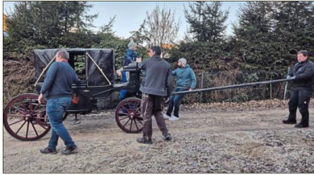
Auch für die Restaurierung der Kutsche „Landauer“ des Trencfekervereins (Schwarz-Panduren) gibt es eine Förderung.

Im Ergebnis werden 17 vielfältige Projekte gefördert. Zur sportlichen Betätigung kann der Verein zur Förderung der Natur-aktiv-Region Althütte-Gibacht-Čerchov für die An-