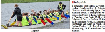
Die Teilnehmer zeigten trotz des schlechten Wetters vollen Einsatz.