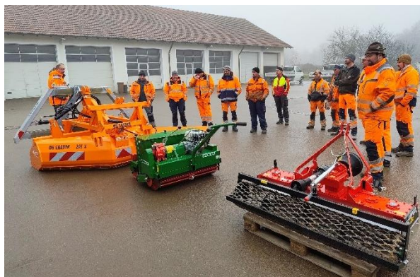
Vorstellung der gemeinsam genutzten Geräte mit Vertretern der Bauhöfe am Bauhof Waldmünchen

Ein praktisches Beispiel für die Vertiefung der interkommunalen Zusammenarbeit im Jahr 2025 stellt die gemeinsame Anschaffung spezialisierter Bauhofgeräte dar. Dieses Projekt wurde durch eine Fraktionsinitiative des Bayerischen Landtags ermöglicht, welche die Arbeit grenzüberschreitender ILE-Zusammenschlüsse mit zusätzlichen Fördermitteln unterstützt. Die Beteiligtenversammlung identifizierte frühzeitig, dass eine gemeinsame Anschaffung als geeignetes Instrument dient, um Synergieeffekte zwischen den kommunalen Bauhöfen zu nutzen und die Kooperation auf praktischer Ebene zu festigen.