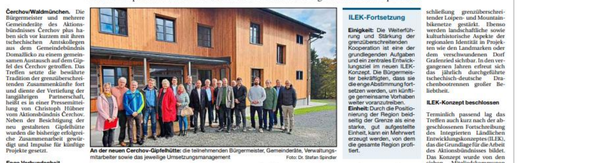
An der neuen Cerchow-Gipfelhütte: die teilnehmenden Bürgermeister, Gemeinderäte, Verwaltungsmitarbeiter sowie das jeweilige Umsetzungsmanagement.

Kommunalpolitiker von beiden Seiten der Grenze besichtigen renovierte Gipfelhütte