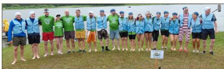
Das Waldmünchen Team mit den Partnerstädtern aus Klekci.