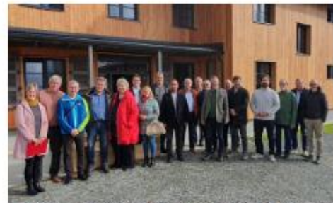
Bürgermeister-Treffen 2025 auf dem Čerchov

Neben dem sportlichen Austausch ist die enge Kooperation auf Verwaltungsebene entscheidend, weshalb im Oktober 2025 das Deutsch-Tschechische Bürgermeister-Treffen und die Zusammenkunft der Touristiker wiederbelebt wurden. Bei gemeinsamen Aktionen wie der Besichtigung der neuen Berghütte auf dem Čerchov und der Further Felsengänge zeigten sich eindrucksvoll die Stärken und Besonderheiten unserer Region. Diese jährlichen Treffen dienen der Vernetzung sowie der Koordination von Interreg-Projekten und bilden damit einen wichtigen Grundstein für die strategische Positionierung der Grenzregion.