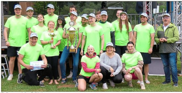
Die Siegemannschaft aus Triefenstein.