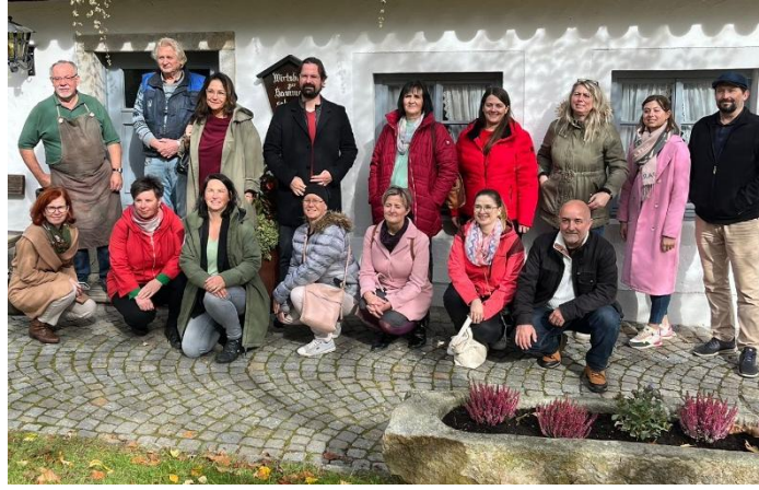
Deutsche und tschechische Vertreter beim Besuch der Hammerschmiede im Rahmen des Touristikertreffens in Furth im Wald

Am 21.10. kamen Vertreterinnen und Vertreter der Tourismusverbände und -Tourist-Informationen sowie weitere touristische Akteure in der deutsch-tschechischen Grenzregion zusammen. Im Fokus des Treffens stand die Vernetzung der verschiedenen Seiten und das Besprechen gemeinsamer Projektideen. Neben der Besichtigung der Furth Felsengänge sowie der historischen Hammerschmiede bot das Treffen Raum zum Kennenlernen der touristischen Partner in der Region