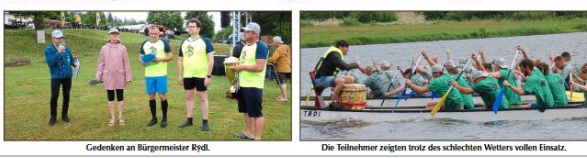
Gedenken an Bürgermeister Ritz.