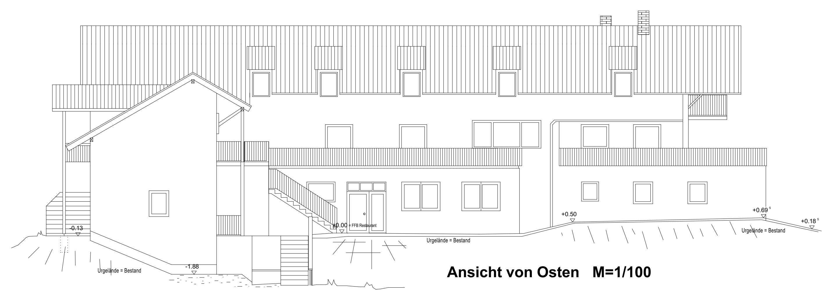
Ansicht von Osten M=1/100