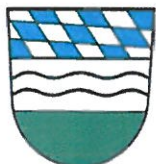
Furth im Wald

Ausblick: Ab 2021 arbeiten wir gemeinsam mit dem tschechischen Bündnis Domažlicko an der Vorbereitung für die neue EU-Förderperiode 2021 – 2027.